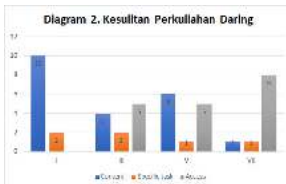
Diagram 2 menunjukkan, kesulitan terbesar disebabkan oleh factor content , yaitu materi yang disampaikan dosen secara on-line , dikarenakan sering terputusnya hubungan internet dan penjelasan menjadi kabur. Pada peringkat kedua kesulitan yang disebabkan oleh akses untuk mendapatkan informasi, terlebih bagi mahasiswa yang sedang menyusun skripsi, akses ke sumber-sumber sejarah, untuk konsultasi, bahkan untuk kerja kelompok pun terkendala khususnya dalam proses heuristik dalam penelitian sejarah (Sjamsuddin, 1989: 86).

Sementara itu kesulitan yang dialami mahasiswa dalam proses belajar-mengajar selama PSBB dapat dikelompokkan ke dalam tiga aspek, yaitu sukar memahami dan mendalami konten dari materi kuliah (tidak semua mata kuliah), menumpuknya tugas di rumah, akses internet yang tidak stabil cukup menjengkelkan dalam menyerap informasi yang diperlukan, konsultasi dengan dosen, wawancara dengan narasumber atau informan dan menemukan sumber primer dalam penulisan sejarah.