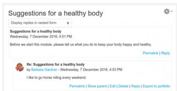
Gambar 2. Diskusi Tunggal Sederhana

Tipe berikutnya, diskusi tunggal sederhana, pemimpin dalam komunitas praktik akan mengirim sebuah pertanyaan yang diperuntukkan bagi setiap anggota. Namun, berbeda dengan tipe sebelumnya, para anggota tidak dapat memulai diskusi baru, melainkan hanya bisa menjawab pertanyaan yang diajukan dalam forum diskusi (Gambar 2). Hal ini berguna untuk menjaga diskusi tetap fokus pada topik tertentu.