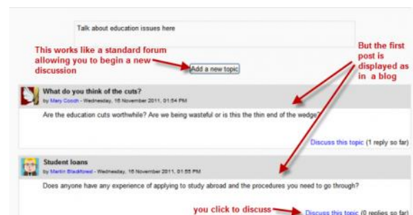
Gambar 4. Forum standar dengan format blog

Tipe terakhir, yang mirip dengan tipe pertama, adalah forum standar dengan format blog. Pada tipe ini, tulisan pertama pada setiap diskusi ditampilkan selayaknya blog, sehingga para anggota dapat membacanya. Selain itu, mereka juga dapat memberi respon pada tulisan tersebut dengan menekan tombol “ Discuss the topic ” pada bagian kanan bawah (Gambar 4).